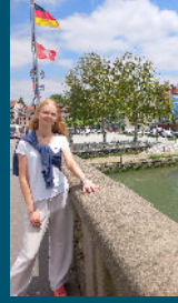
SALIDA A BAYONNA